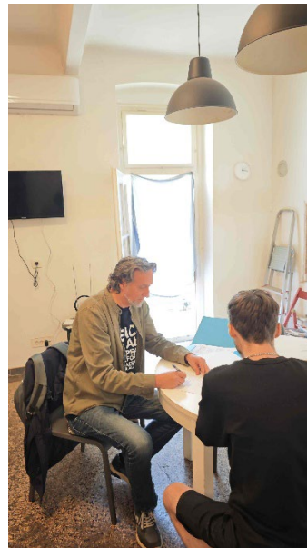
u stambenoj zajednici..

Brojanje je pokazalo da je broj beskućnika na ulici u Rijeci u okvirima očekivanog. Rezultati će biti javno dostupni nakon što završni izvještaj bude prihvaćen u Europskoj komisiji, sredinom 2026 godine.